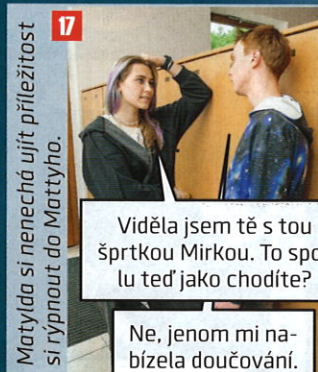
Matylda si nenechá ujít příležitost si rýpnout do Matyho.

17 Viděla jsem tě s tou šprtou Mirkou. To spolu teď jako chodíte?