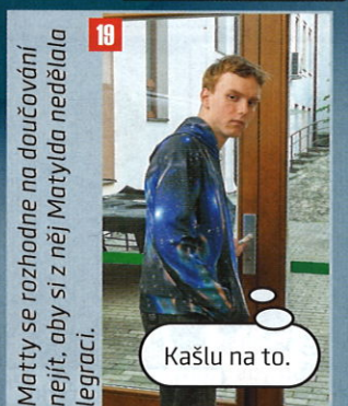
Maty se rozhodne na doučování nejít, aby si z něj Matylda nedělala legraci.